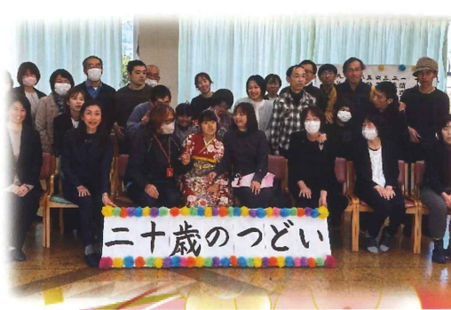
二十歳のつどいで大人の仲間入り♡

く初春を迎えました！ 新春の清々しさとともに新たな年を迎えることができました。丘のうえの東遠学園から見る初日の出は、新年の幕開けとして特別な思いを感じさせられます。 東遠学園児童部青年部では、新年を迎え、初詣や餅つきなど恒例の行事を行いました。新たな年を迎え、希望に満ちた日々のスタートとして子どもたちや利用者が特別な雰囲気を感じていました。 また、1月13日(月)には、二十歳を迎えた利用者の「二十歳のつどい」を開催いたしました。高校時代の恩師や仲間からのお祝いの言葉を頂き、和やかに希望に満ちたつどいを取り持つことができました。 本年も東遠学園組合に関わる全ての皆様が無事に、そして笑顔に満ちた日々を過ごせますようお願い、穏やかな一年間でありまして、心をよりお祈り申し上げます。 本年もよろしく願っています。