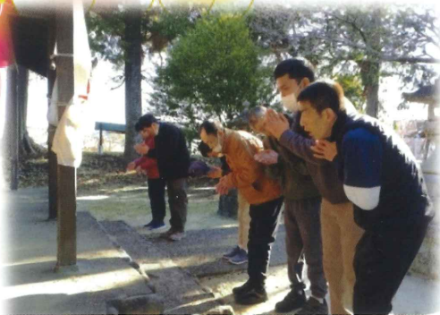
初詣に行ってきました！