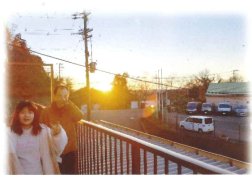
初日の出綺麗だなぁ☀