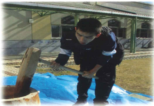
カ一杯お餅をついています！