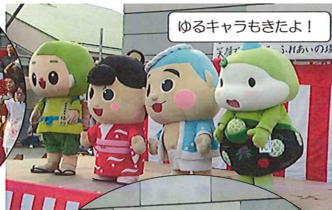
ゆるキャラもきたよ!